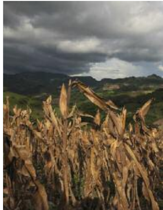
Gescheiterte Entwicklung: Die Großplantage kehrt zurück, und aus Tagelöhnerfamilien