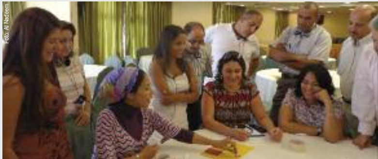
Wenn Männer mal zuhören: Al Nadeem Center in Kairo.

S elbst im Jahr II nach dem Sturz des Raïs Mubarak hält die Veränderung an. Niemals zuvor haben die Menschen in dem 80-Millionen-Land die Erfahrung gemacht, eine Regierung verändern, geschweige denn stürzen zu können; erst-