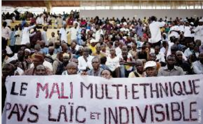
Mali bleibt multiethnisch, laizistisch und unteilbar – Protestveranstaltung in Bamako.