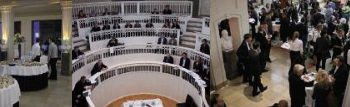
Häppchen, Vorträge und Stehempfang: Markt und Medizin beim Weltgesundheitsgipfel.

– und verkauften, wenn sie etwas darüber hinaus produzieren. Ihre Commons verwalteten sie selbst. Helfrich ist davon überzeugt, dass „wir rausmüssen aus der Illusion“, der Staat werde es richten. Für sie war die entscheidende Frage des Abends, wie man das Denken ändern könne und „dass es neben der Dichotomie