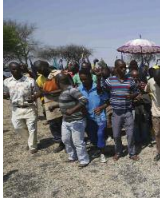
Die Zivilgesellschaft nennt es ein „Massaker“, der ANC eine „Tragödie“: Protest

medico: Im Zuge des Bergarbeiterstreiks in einer Platinmine im südafrikanischen Marikana wurden im August 2012 34 Menschen von der Polizei getötet. Was hat dieses Ereignis ausgelöst?