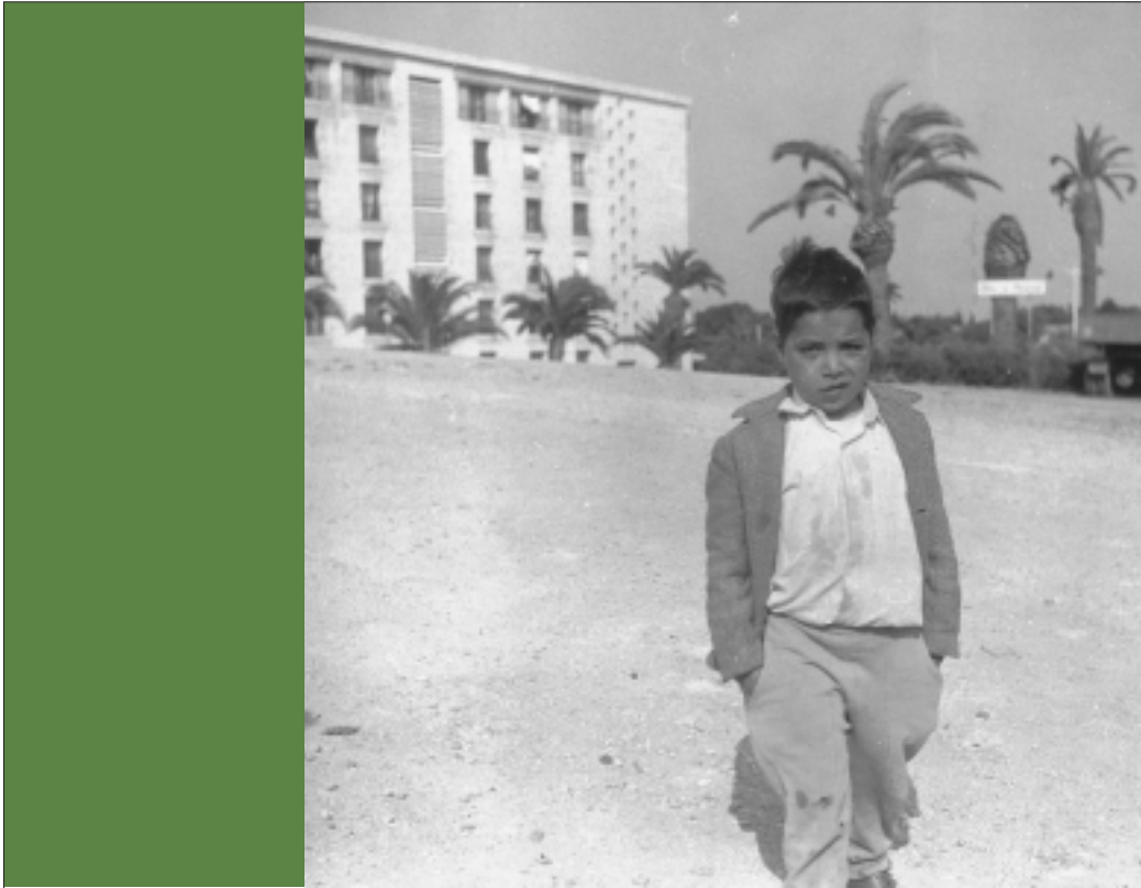
Pierre Bourdieu, Ohne Titel, R 10, ca. 1958