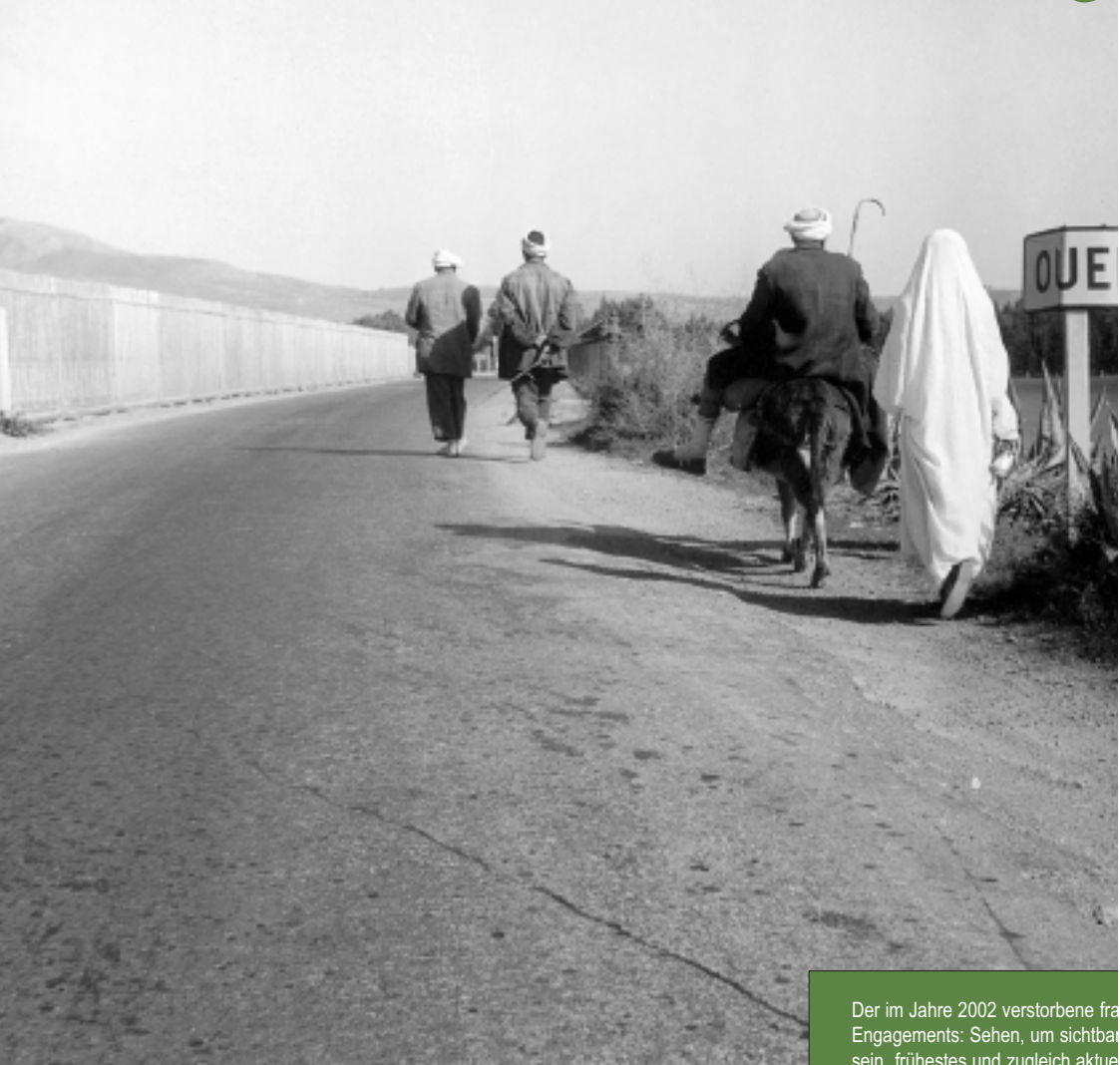
Pierre Bourdieu, Oued Fodda, Chélif, R 3

Der im Jahre 2002 verstorbene fra Engagements: Sehen, um sichtbar sein „frühestes und zugleich aktue