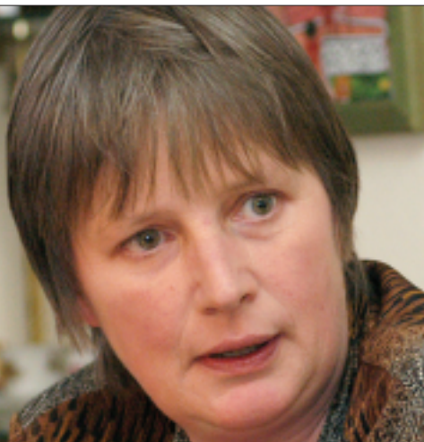
B. Gaus: Die Zweckbindung von Spenden verhindert eine politisch intelligente Hilfe.