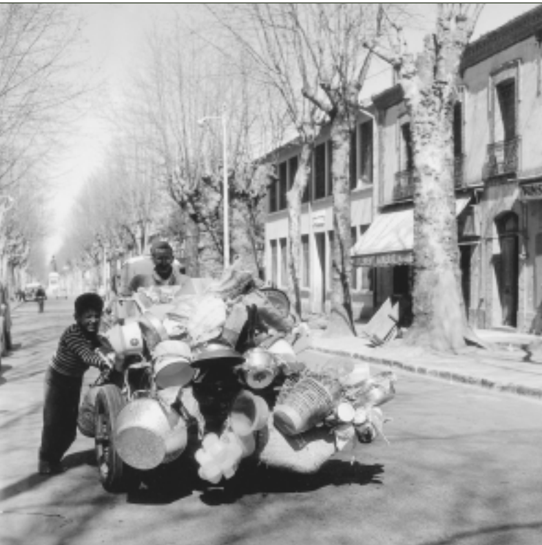
Pierre Bourdieu, Straßenhändler, Bab-el-Oued, April 1959, R 14

allen vom Tsunami betroffenen Ländern Informationen zu den Folgen der Katastrophe zu sammeln, um ihren Überlebenden eine Stimme zu verleihen, auf englisch, singhalesisch und tamilisch. Schon am nächsten Tag wird die Arbeit