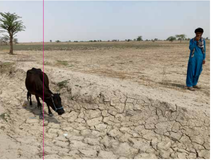
Zerstörte Lebensgrundlagen: Wo Reisfelder waren, bleiben ausgedörrte Böden.