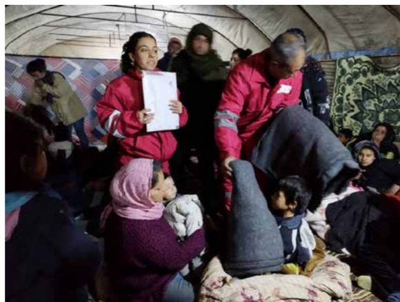
Hilfe muss alle erreichen: Kritische Nothilfe nach dem Erdbeben in Nordostsyrien

Ob Naturkatastrophe, Hungersnot oder Krieg: Auch in akuten Krisen unterstützt medico das selbstbestimmte Handeln der Menschen vor Ort. So war es auch, als Anfang 2023 die Erde in der Türkei und im Norden Syriens bebte und verheerende Schäden anrichtete. Initiativen und Organisationen aus der Region, mit denen wir seit Jahren vertrauensvoll zusammenarbeiten, organisierten unmittelbar Nothilfe. Als lokale Expert:innen der Selbsthilfe wissen sie am besten, was gebraucht wird. Und sie sind auch dann noch präsent, wenn internationale Organisationen wieder verschwunden sind. Aktuell setzen sich unsere Partner:innen in der Türkei und Nordsyrien für einen gerechten Wiederaufbau ein.