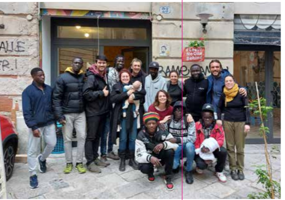
Solidarität statt Abschottung: das Maldusa-Zentrum in Palermo